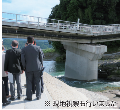
※現地視察も行いました

椋野市長より「5つの基本施策」の説明、国道386号線※三郎丸橋の被災にかかる支援等の要請 等